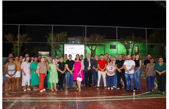
10/05/2025 - Sítio Lagedo Grande e adjacências